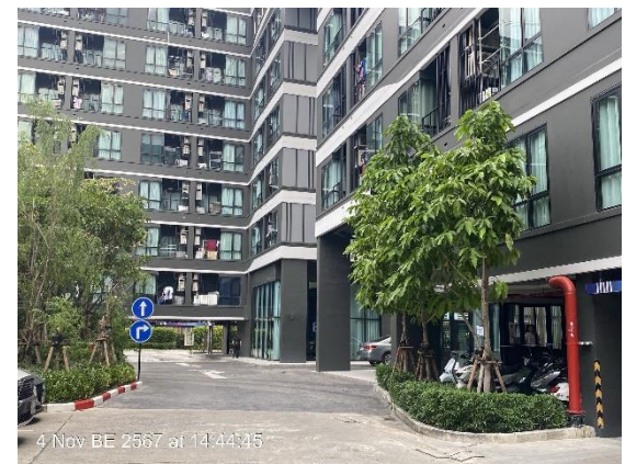
ภาพที่ 1.2-2 สภาพปัจจุบันโครงการ